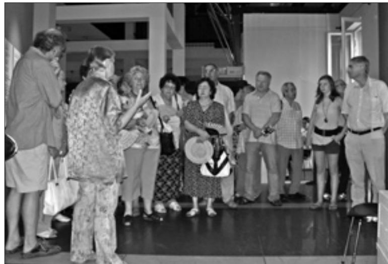
Aufmerksam lauschen die Bamberger Ausstellungsbesucher in Frankfurt den Erklärungen.

как сегодня, напоминающие о победе над нацизмом, во время господства которого было чудовищно убито 6 миллионов невинных евреев, не дают забыть нам о том, какие жуткие страдания люди в состоянии доставить другим людям. К сожалению, все надежды не осуществились за эти 65 лет. Но мы должны все же полные надежд и веры смотреть в будущее, несмотря на прошлое. И прежде всего мы должны делать все, чтобы действительно мирное будущее наступило. Перевод Татьяны Манастырской