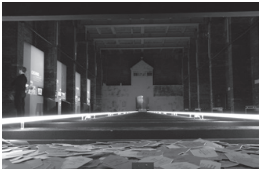
Installation „Das Gleis“ in der Ausstellung „Sonderzüge in den Tod“

Die Züge waren als „Sonderzüge“ getarnt, die Transporte selbst als „Ost-Umsiedlung“ verharmlost. Millionen von Juden hat die Reichsbahn während der Nazi-Zeit in überfüllten Güterzügen in die Vernichtungslager in Osteuropa gebracht. Die Sonderausstellung im Dokumentationszentrum auf dem Nürnberger Reichsparteitagsgelände setzt sich mit der „Logistik des Rassenwahns“ auseinander und schildert die Willfährigkeit, mit der die Reichsbahn und ihre Mitarbeiter der Hitler-Diktatur zu Diensten waren. Sehenswert wird die Ausstellung durch die Inszenierung in dem Backsteinmauerwerk der früheren Nazi-Kongresshalle. Der Besucher erlebt den Weg