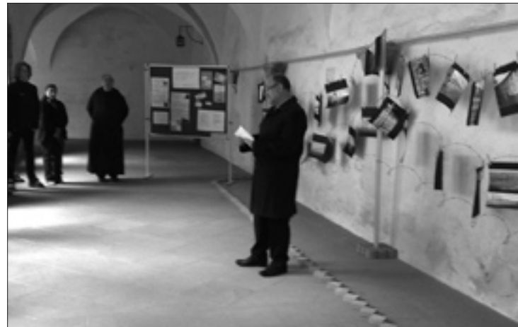
Bürgermeister Werner Hipelius bei der Eröffnung der Ausstellung mit Fotos aus Auschwitz von Schülerinnen und Schülern des Kaiser-Heinrich-Gymnasiums

Schmitt. Die Veranstaltung wurde durch die musikalische Begleitung einer Schülerin des KHG umrahmt.