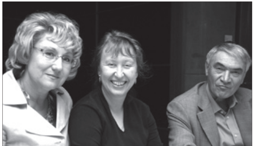
Bild oben: An der Feier des Sederabends im voll besetzten Gemeindesaal nahmen diesmal auch Reporter des Fränkischen Tags teil.