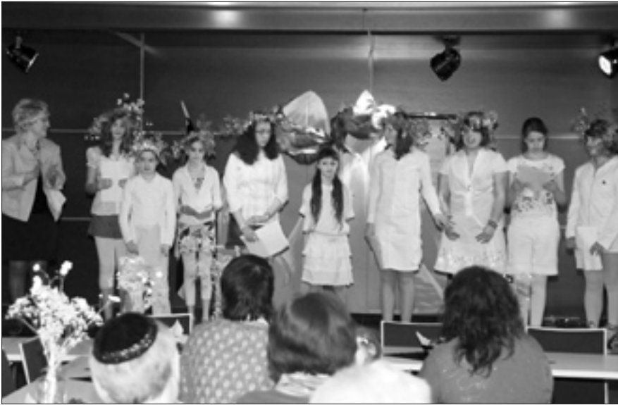
Die Kinder nehmen am Ende ihrer Darbietung anlässlich der Schawuot-Feier den verdienten Applaus entgegen (siehe Seite 11).