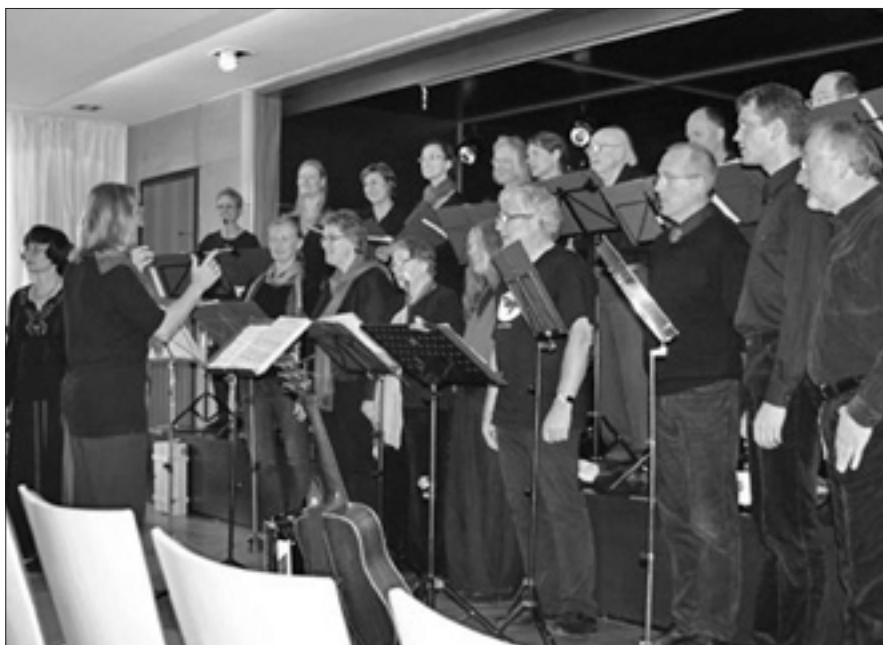
Der Chor „Inspiration“ bei seinem Auftritt im Willy-Lessing-Saal

Chasan Arie Rudolph führte bei strahlendem Wetter eine Gruppe interessierter Bürger durch den Isra-