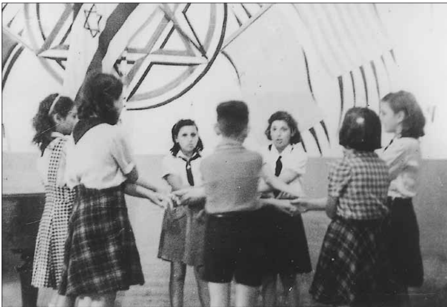
Jüdische Kinder bei einer Aufführung der Theatergruppe Strüth