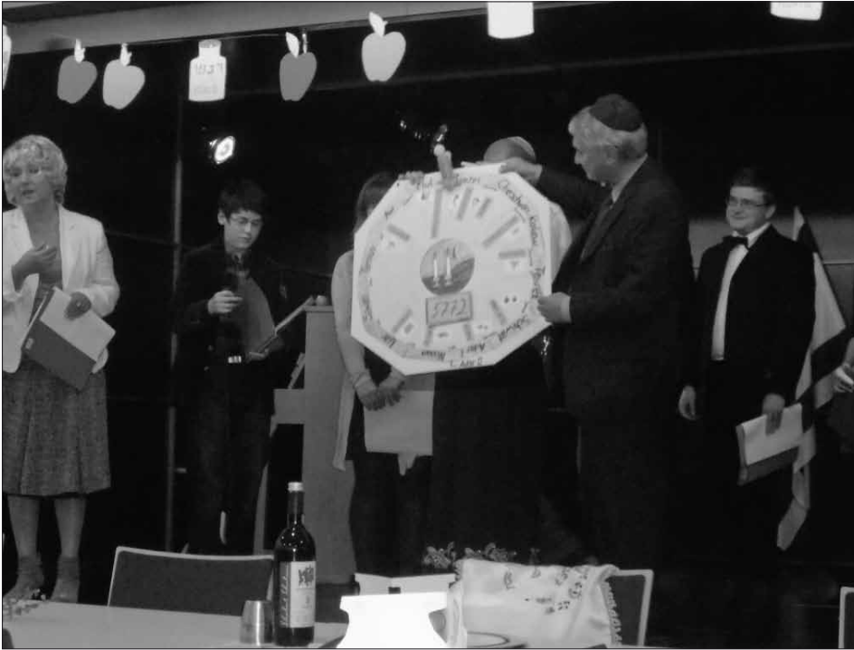
Die Jugendlichen präsentieren bei der Feier den selbst gebastelten jüdischen Kalender.

Zu den Hauptfesttagen war die Synagoge traditionell gut besucht. Auch in- und ausländische Gäste kamen gerne, um sich einen Einblick in die Lebendigkeit der Gemeinde zu verschaffen. Die Kinder und Jugendli-