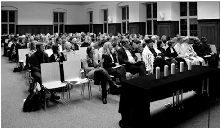
Beim Multireligiösen Semesterbeginn war der Raum gut gefüllt. In der ersten Reihe sitzen Vertreter der Universität sowie der jüdischen, der christlichen und der islamischen Religion.

wider, die nicht nur in der Katholischen und der Evangelischen Theologie, sondern auch in der Judaistik und Islamwissenschaft im Mittelpunkt steht.