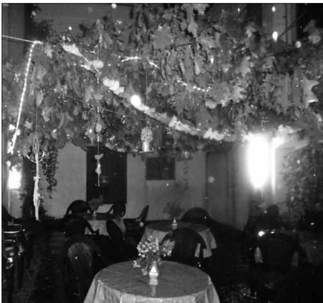
Die Sukka (Laubhütte) im Regen.

После речи г-на Рудольфа, г-жа Дойзель прочла